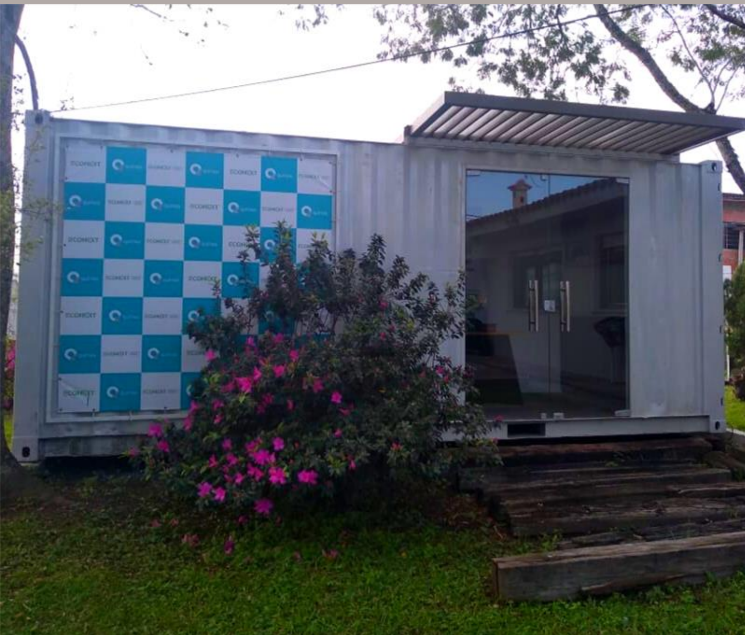
Modelo de unidade em container.